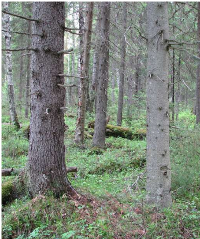
Стволы ели и пихты.

Красная книга Вологодской области: категория статуса редкости 3 – редкий вид.