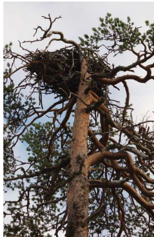
Гнездо скопы.