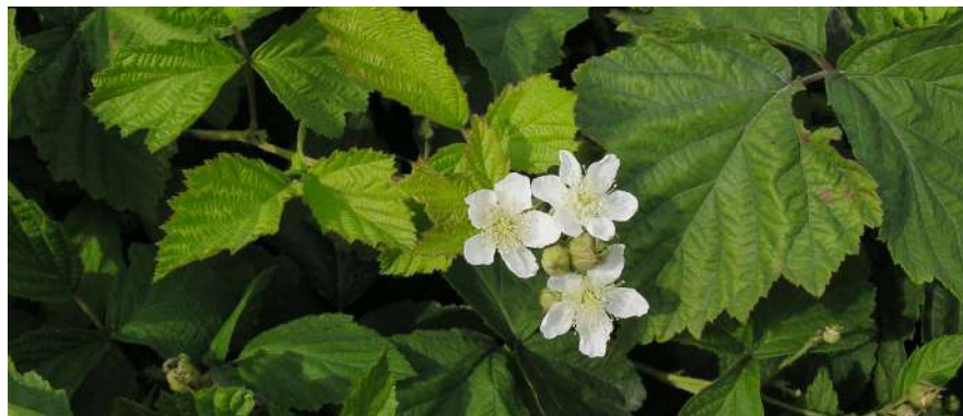
Фото: Слава Беспалов. https://www.plantarium.ru/page/image/id/161664.html