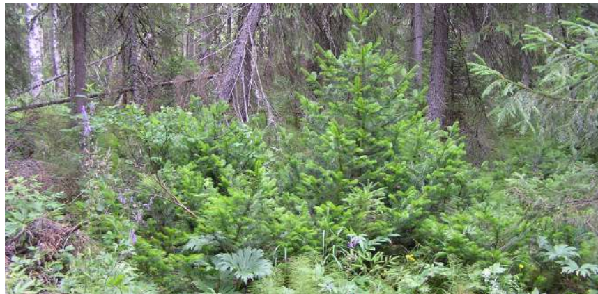
Пихты молодые.