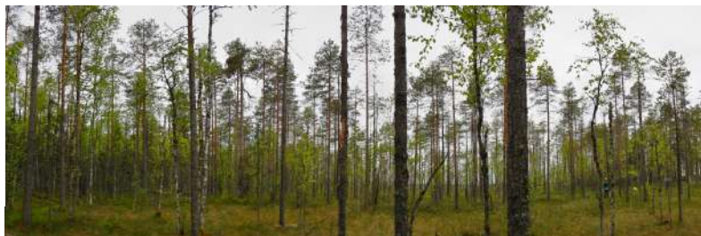
Гнездо беркута в разряженном сосняке на краю верхового болота.