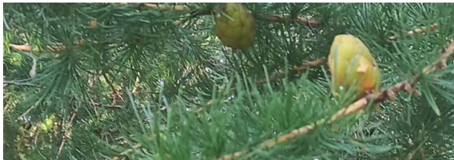
Фото: Терентьева Н.Ю.