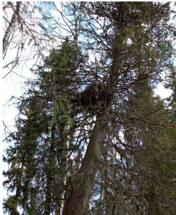
Гнездо подорлика в Ленском районе