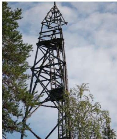
Гнездо беркута на вышке.