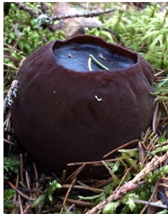
Плодовые тела Саркосомы шаровидной тёмно-коричневого цвета диаметром 6 см - 8 см.