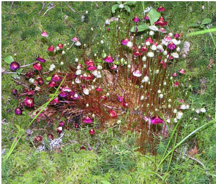
Сплахнум красный и сплахнум желтый.

Красная книга Архангельской области: категория статуса редкости 2 - сокращающиеся в численности и/или распространении.